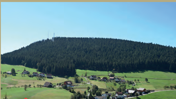
Ihr Blick aus jedem Sonnenhalde-Zimmer

Summertime – weitab vom Alltag. Nach einem Bad im Pool träumt man von nichts anderem als von purer Entspannung.