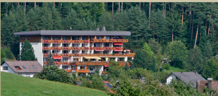
Ferien- und Wellnesshotel

Treten Sie ein, seien Sie willkommen. Die nächsten Tage gehören Ihnen. Nehmen Sie sich Zeit und genießen Sie.